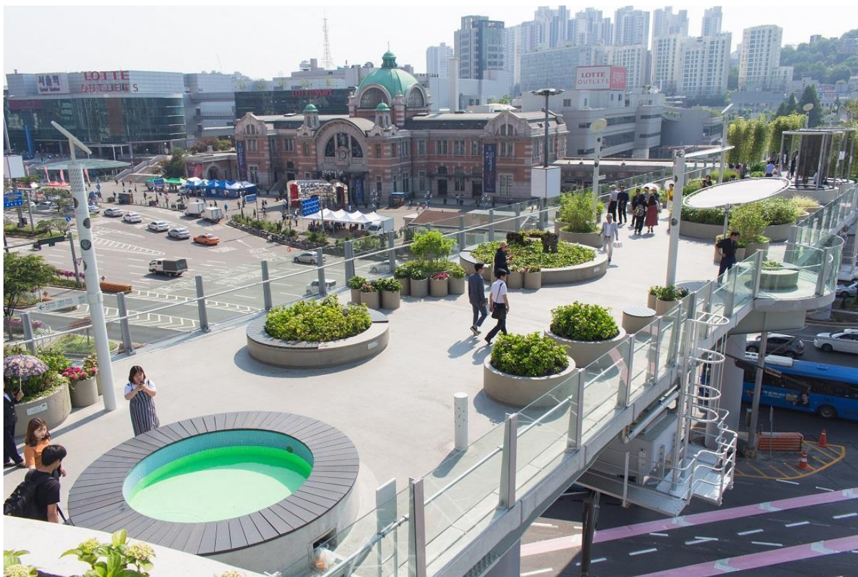
The Garden of Morning Calm