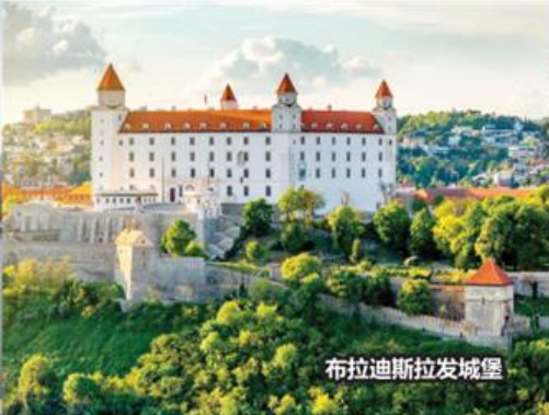
布拉迪斯拉发城堡