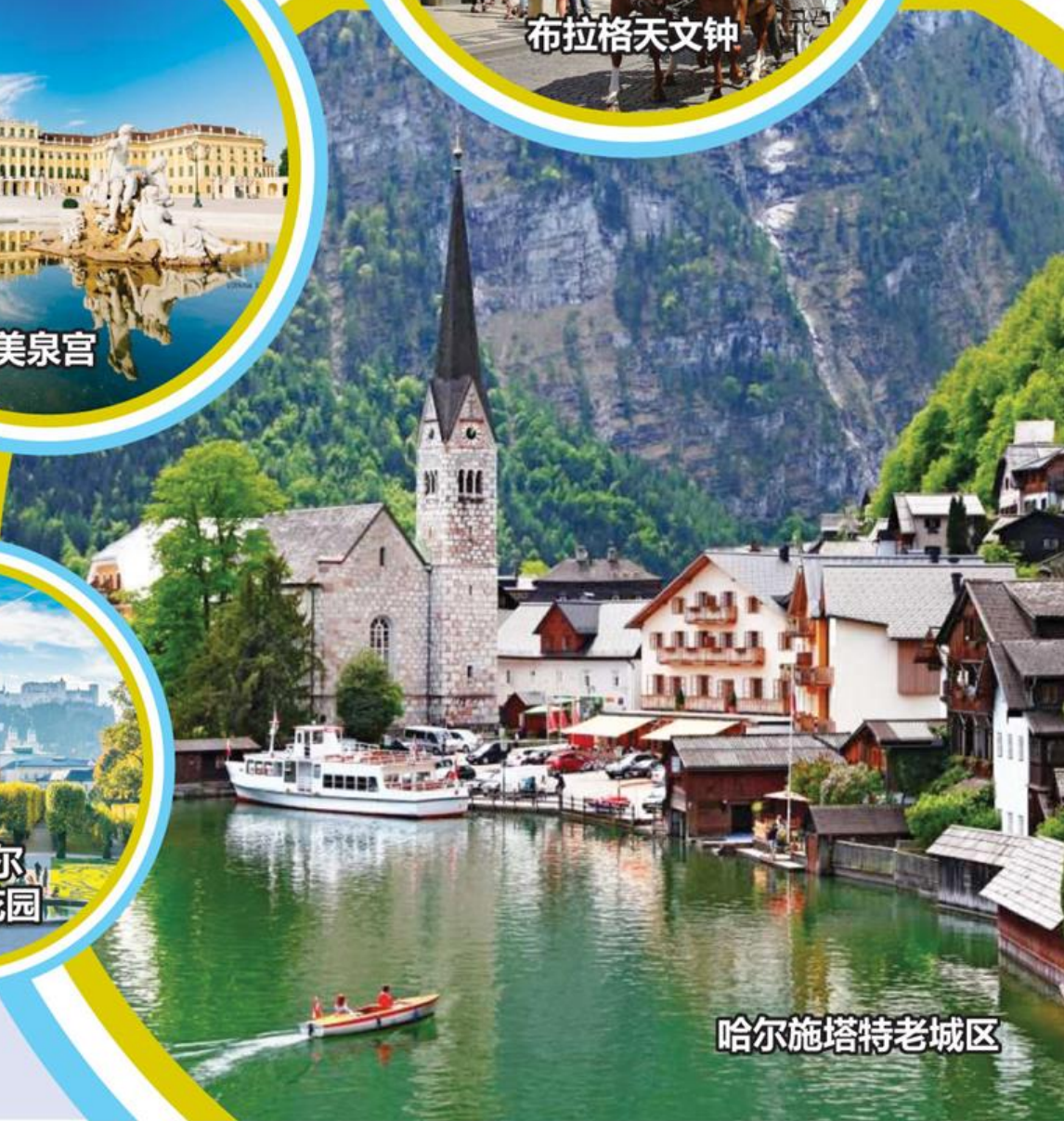
哈尔施塔特老城区