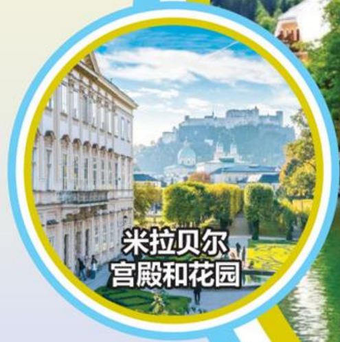
米拉贝尔 宫殿和花园