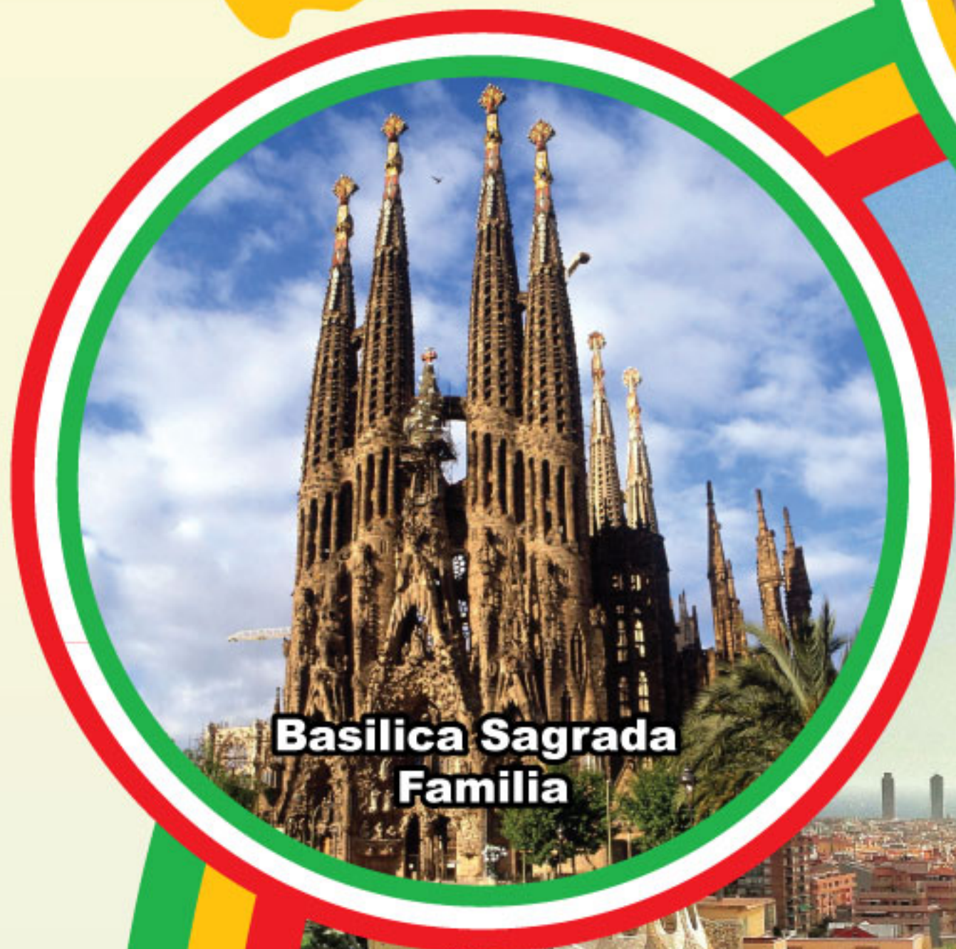
Basilica Sagrada Familia