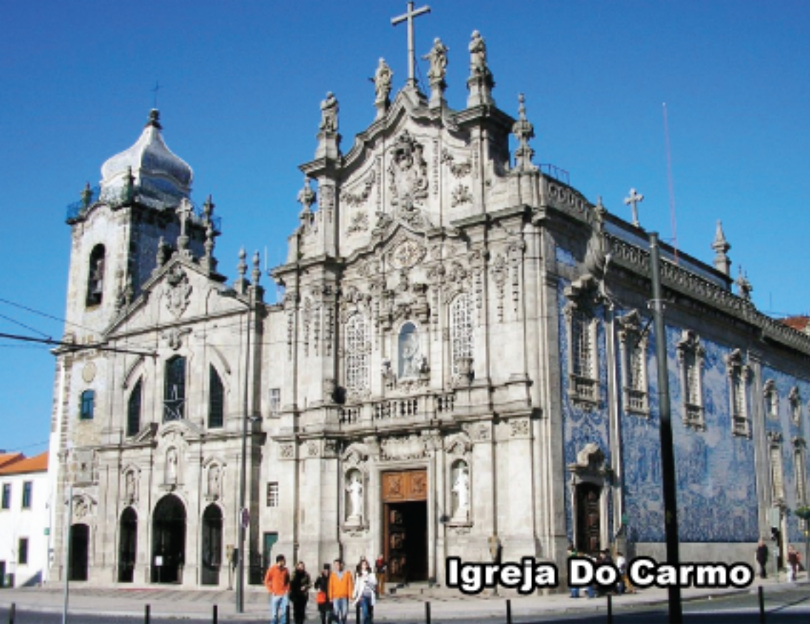
Igreja Do Carmo