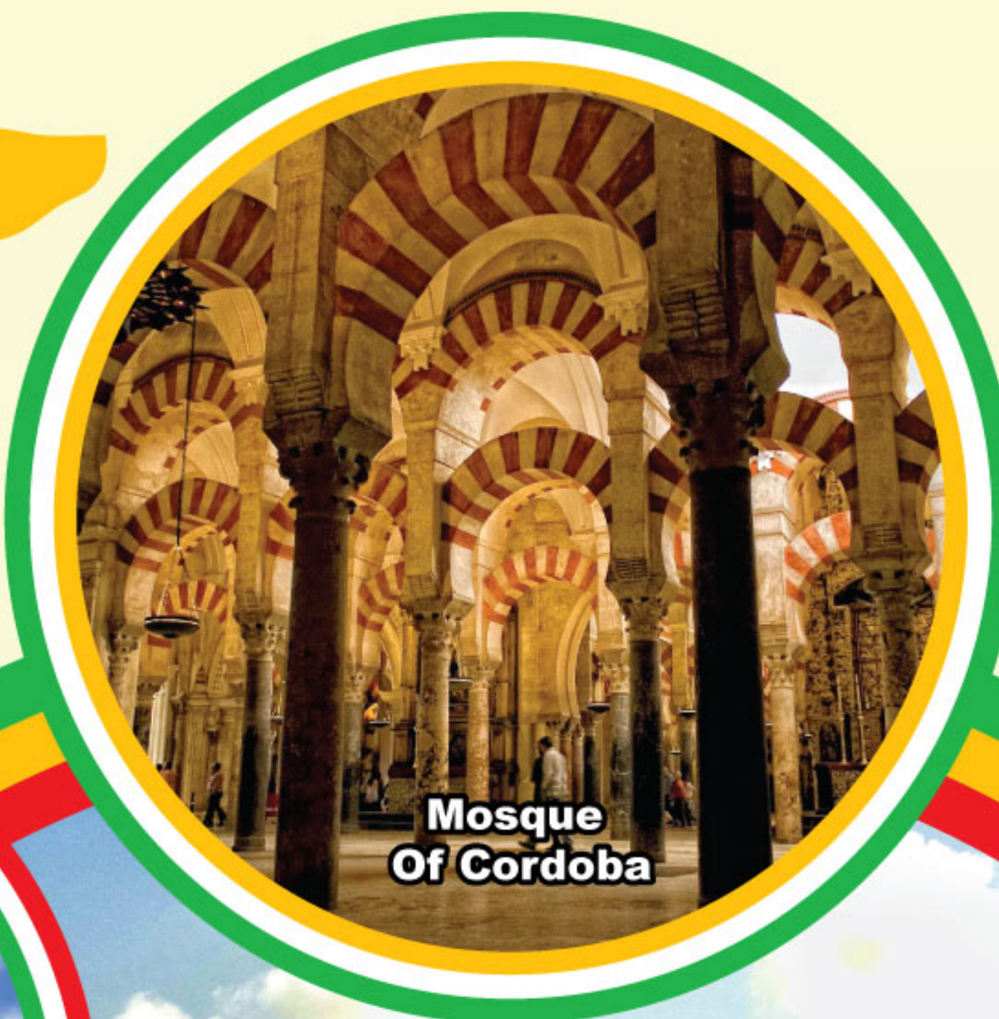
Mosque Of Cordoba