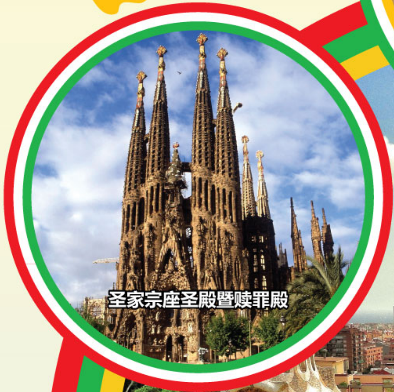
圣家宗座圣殿暨赎罪殿