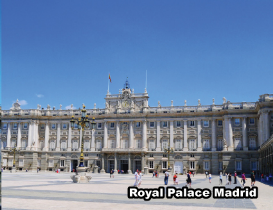
Royal Palace Madrid