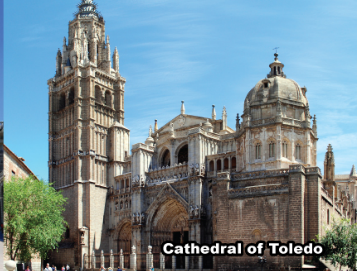
Cathedral of Toledo