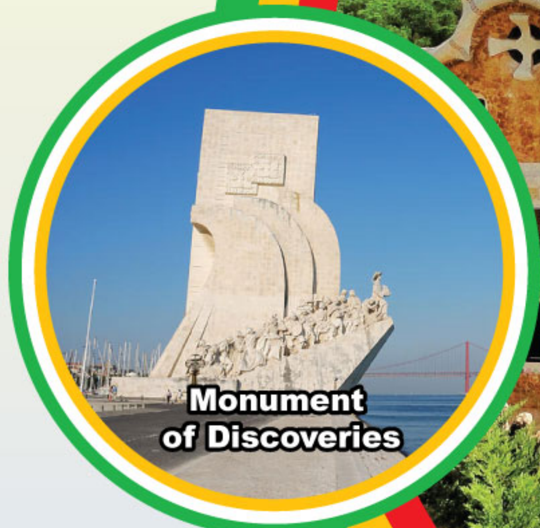
Monument of Discoveries