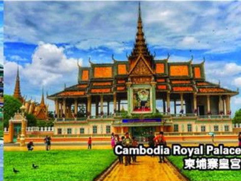
Cambodia Royal Palace 柬埔寨皇宮