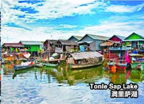
Tonle Sap Lake 洞里萨湖