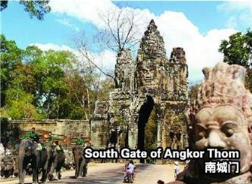
South Gate of Angkor Thom 南城门