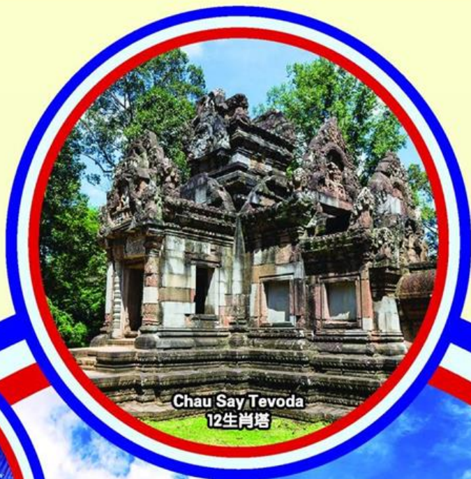
Chau Say Tevoda 12生肖塔