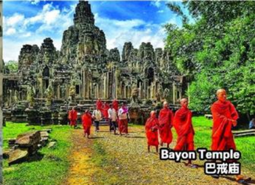
Bayon Temple 巴戎庙