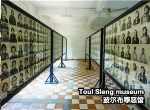
Toul Sleng museum 波尔布罪恶馆