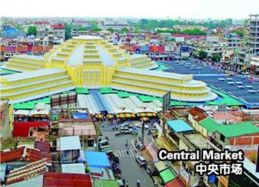
Central Market 中央市场