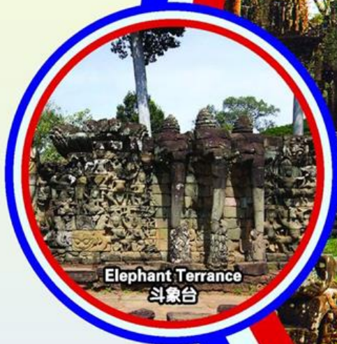
Elephant Terrace 斗象台

行程次序·以当地旅社安排为准。 Sequences of Itinerary are subject to local arrangement.