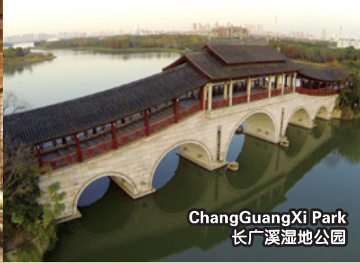
ChangGuangXi Park 长广溪湿地公园