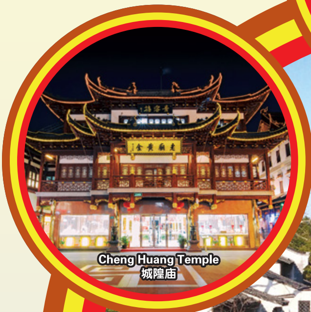
Cheng Huang Temple 城隍庙