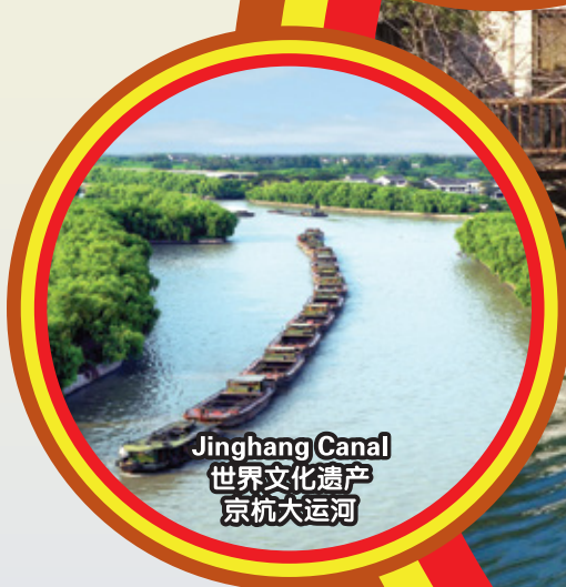
Jinghang Canal 世界文化遗产 京杭大运河

行程次序，以当地旅社安排为准。 Sequences of Itinerary are subject to local arrangement.