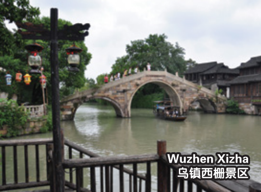
Wuzhen Xizha 乌镇西栅景区