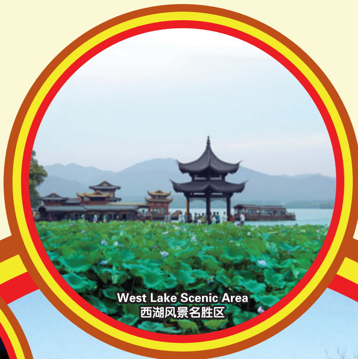
West Lake Scenic Area 西湖风景名胜区