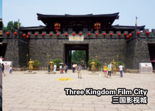
Three Kingdom Film City 三国影视城