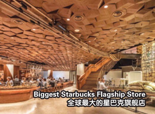
Biggest Starbucks Flagship Store 全球最大的星巴克旗舰店