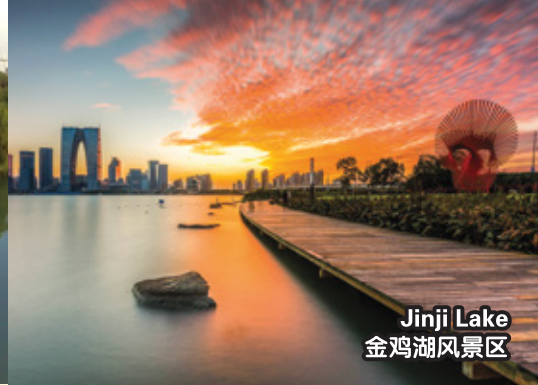
Jinji Lake 金鸡湖风景区